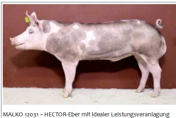
MALKO 12031 – HECTOR-Eber mit idealer Leistungsveranlagung

Ergebnisse von Prüfebem, LSZ Boxberg Mai und Juni 2018